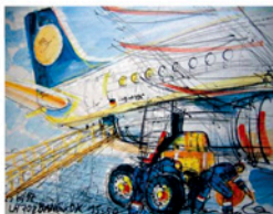
Dipl. Formgestalter Uli Schaarschmidt