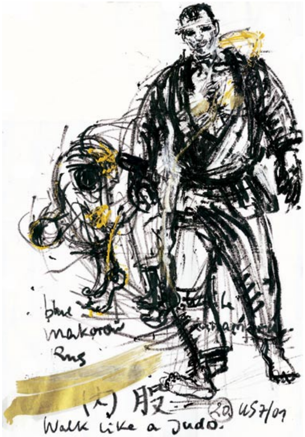
Gehender Mann - 2001 - Kreide, Acryl auf Papier 56 x 78 cm