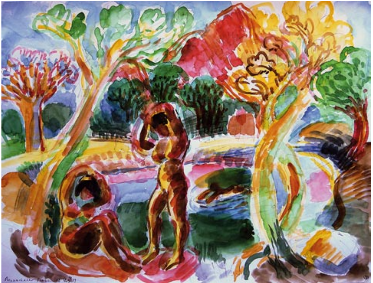
Badende - 2008 - Aquarell 36 x 48 cm