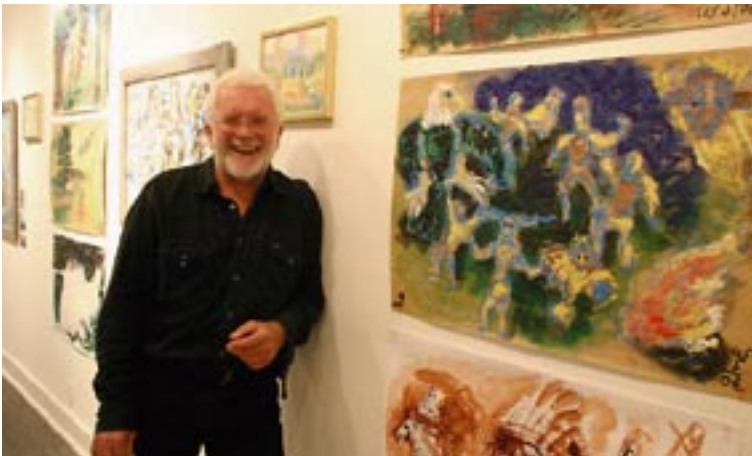
Dance / Tanz - 2007 - Acryl auf Packpapier 56 x 78 cm