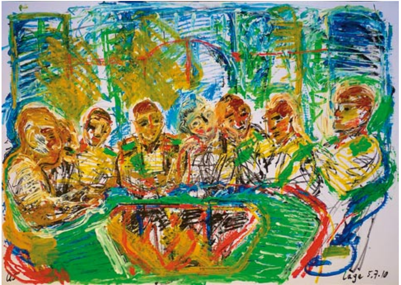
Lage - 2010 - Acryl auf Fedrigoni Karton 70 x 100 cm