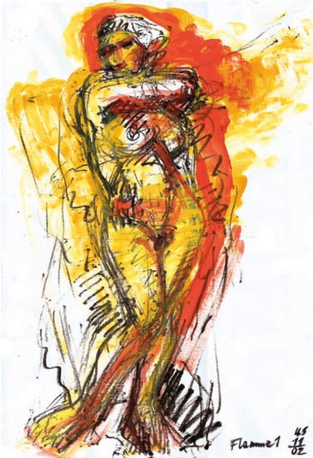
Stehende Frau - 2002 - Kreide, Acryl auf Papier 56 x 78 cm