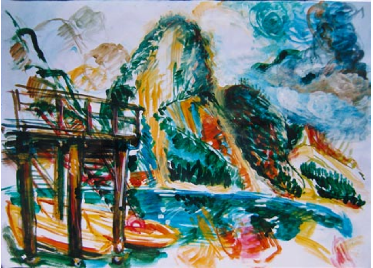
Abfahrt (Wildsee) - 2003 - Acryl auf Papier 56 x 78 cm *)