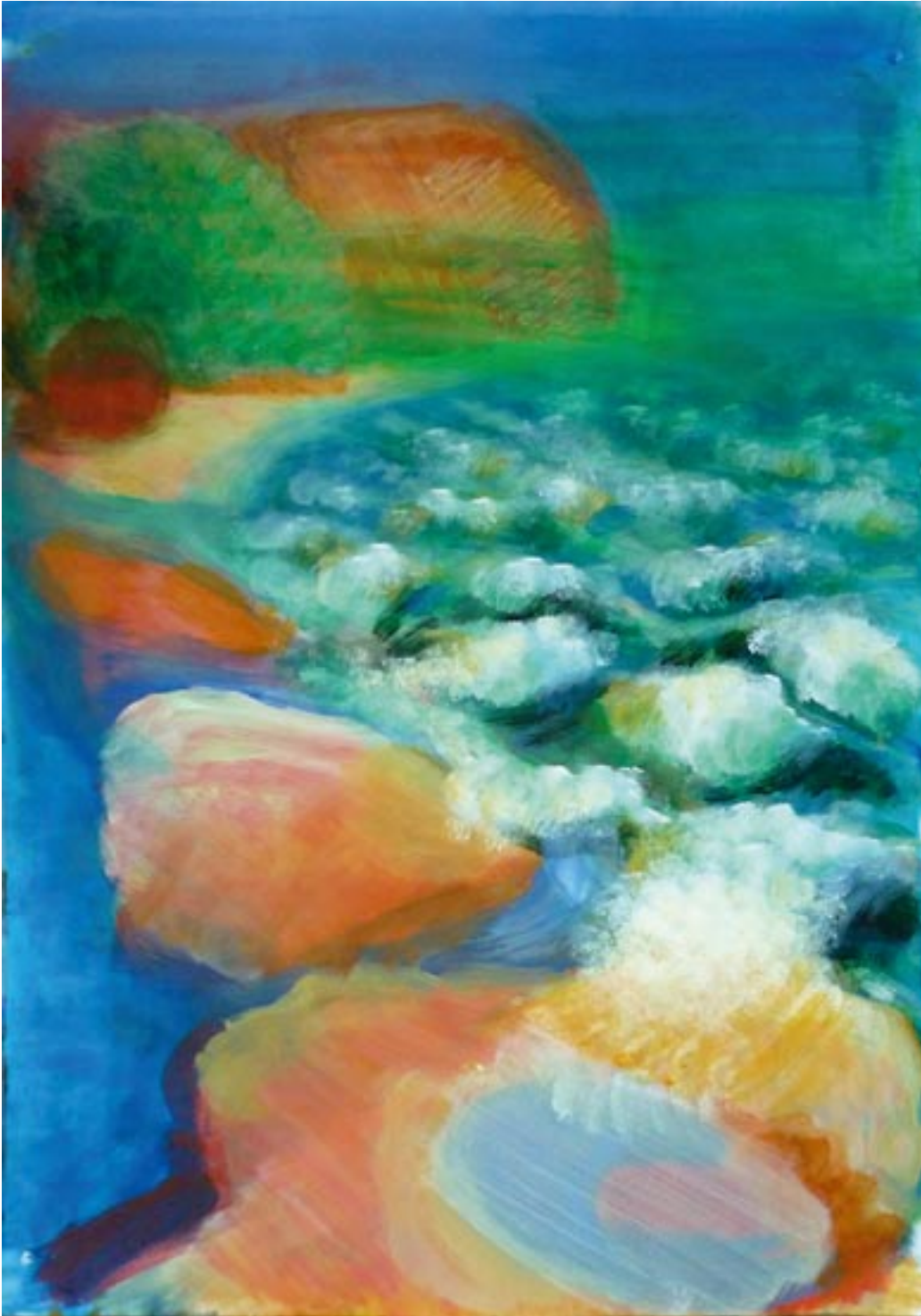
Gefrorene See - 2007 - Acryl auf Fedrigoni Karton 56 x 78 cm