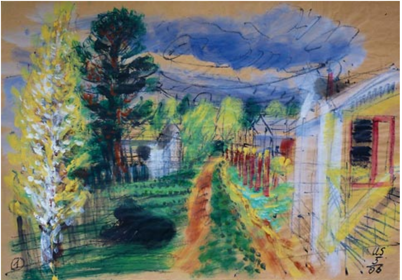
Young Adam hung up himself - Adam hat sich aufgehängt - 2006 - Acryl auf Packpapier 56 x 78 cm