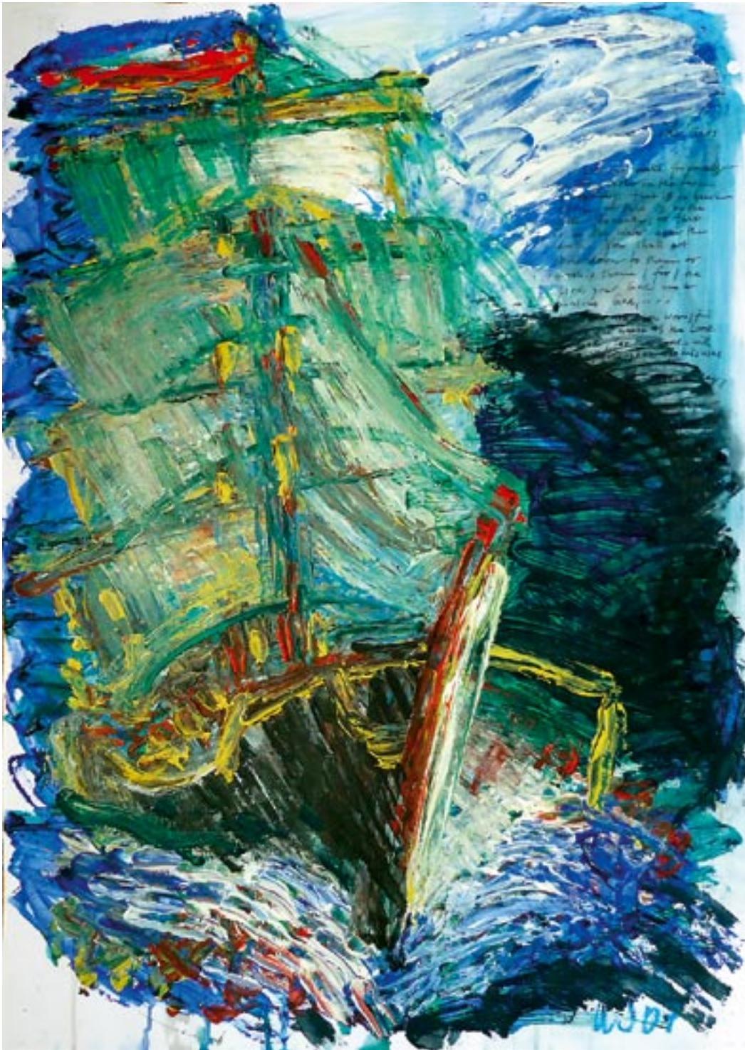
Dark barque (10 commands) / Dunkle Bark (10 Gebote) - 2006 - Acryl auf Fedrigoni Karton 56 x 78 cm