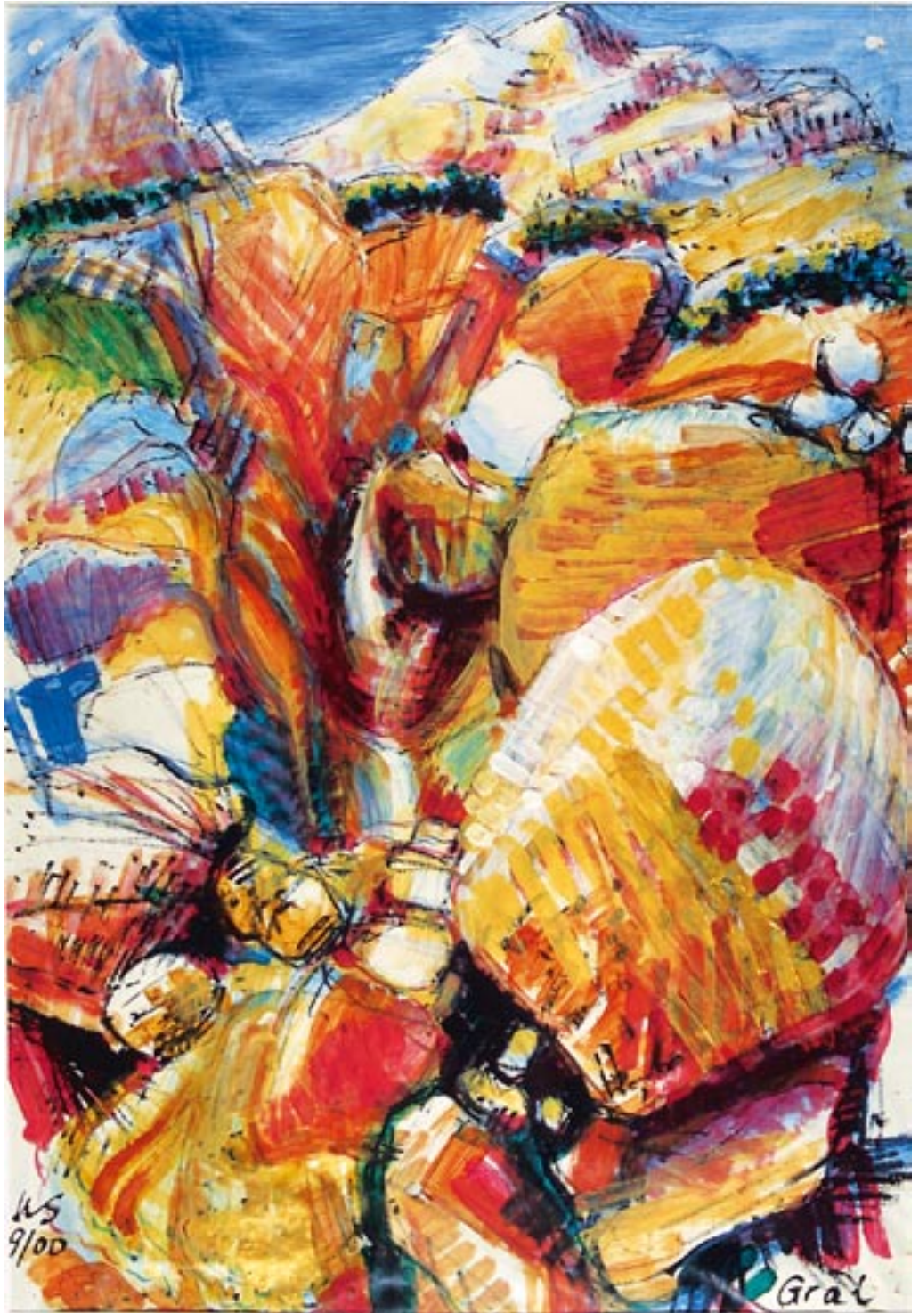
Grail - 2000 - Kreide, Acryl auf Papier 56 x 78 cm