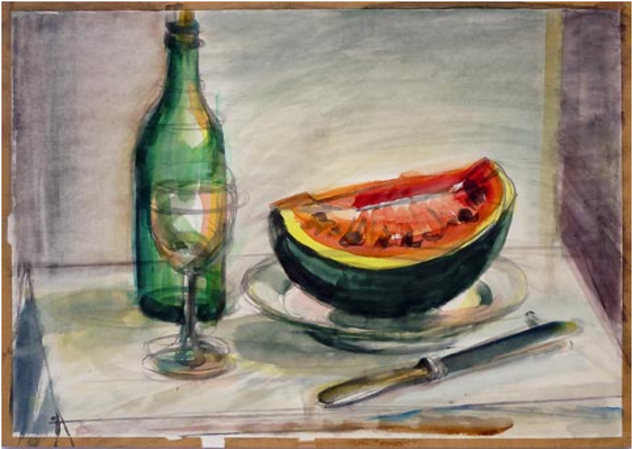
Stilleben - 1986 - Aquarell 60 x 80 cm