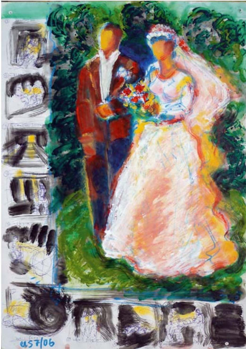
Miners wedding / Bergmanns Hochzeit - 2006 - Acryl auf Papier 56 x 78 cm