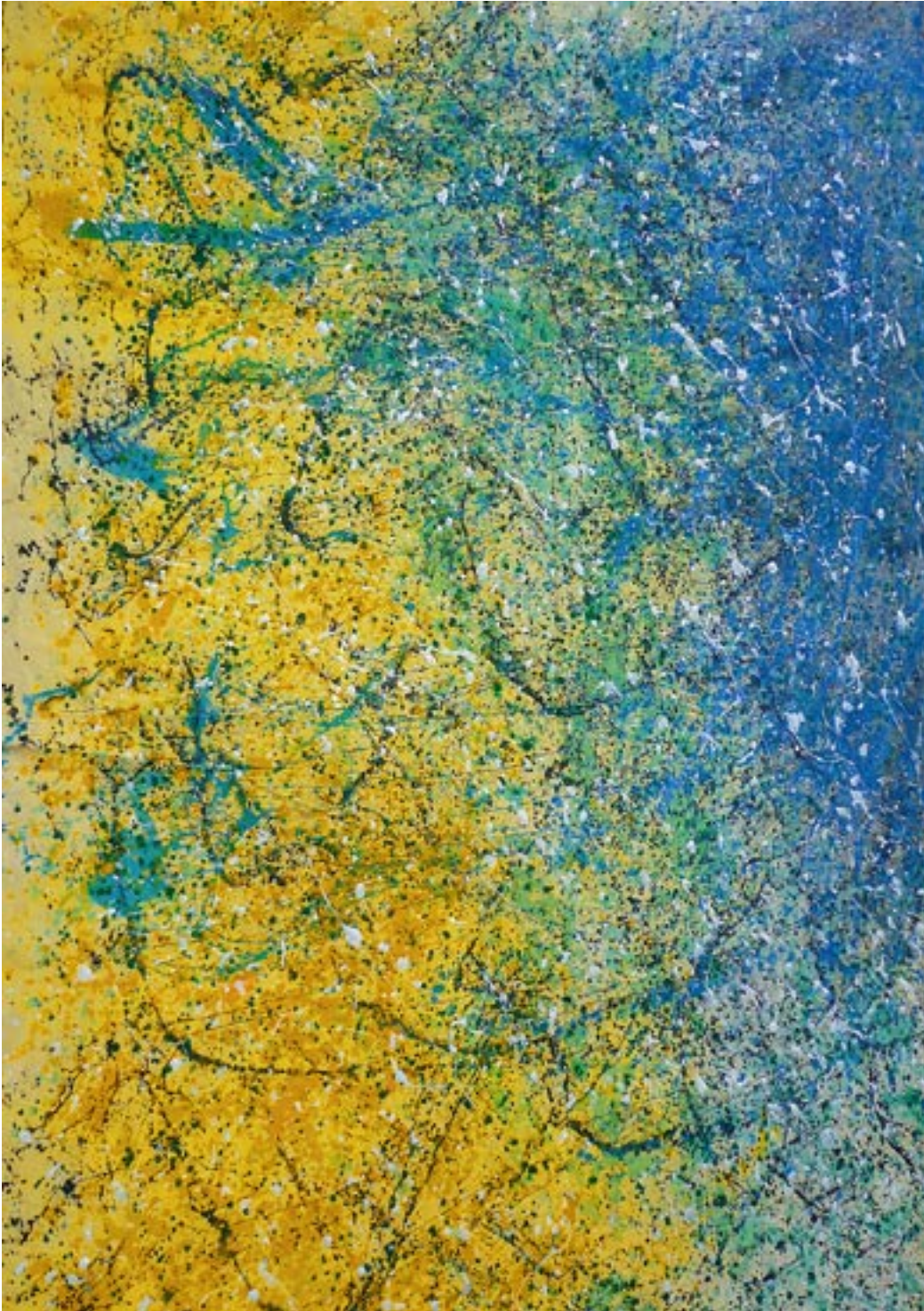
Fraktal (Detail) - 2004-2010 - Acryl auf Leinwand 200 x 300 cm