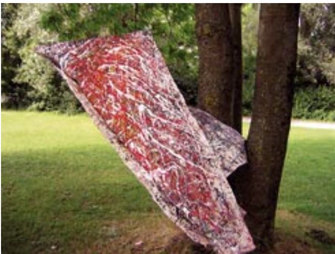
Fraktale - 2004/2005 - Acryl auf Leinwand 150 x 170 cm - Sun ray / Sonnenstrahl *)