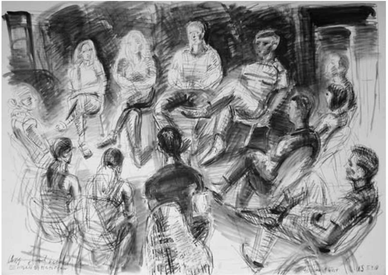
Abschnitt West - 2010 - Kreide auf Fedrigoni Karton 70 x 100 cm