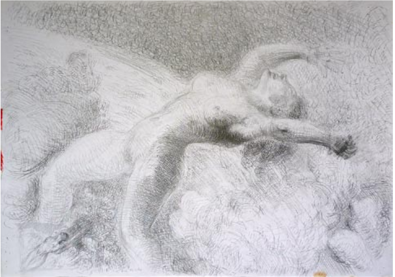
Ewa, am Gleitschirm 10.000 m hoch gewirbelt - 2008 - Bleistift Zeichnung 56 x 78 cm