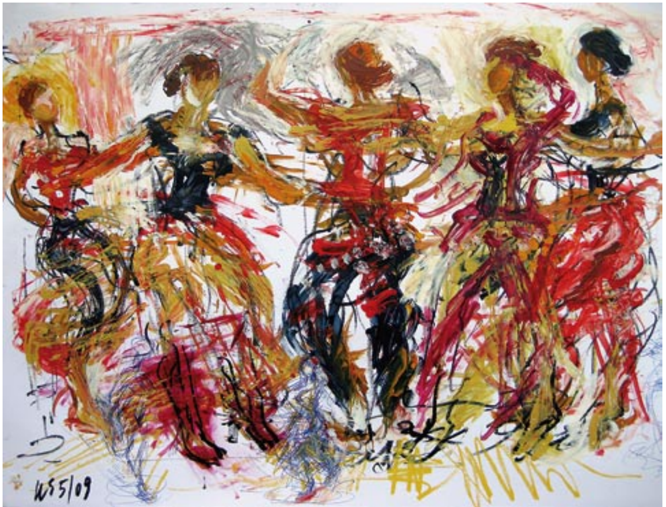
Tanzende - 2010 - Kreide, Acryl auf Fedrigoni Karton 56 x 78 cm