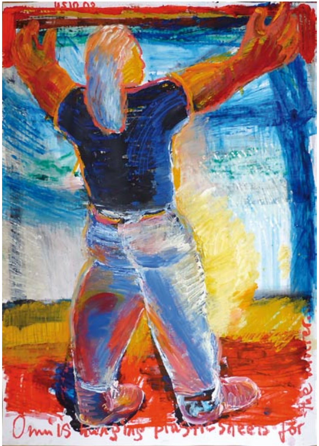
Onni - 2008 - Acryl auf Fedrigoni Karton 70 x 100 cm