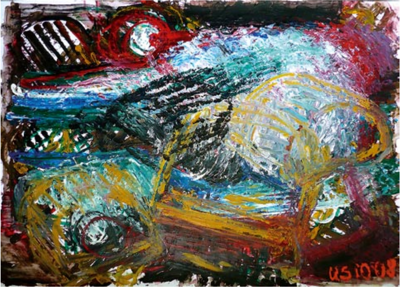
Lobster traps / Hummer Fallen - 2008 - Acryl auf Fedrigoni Karton 70 x 100 cm