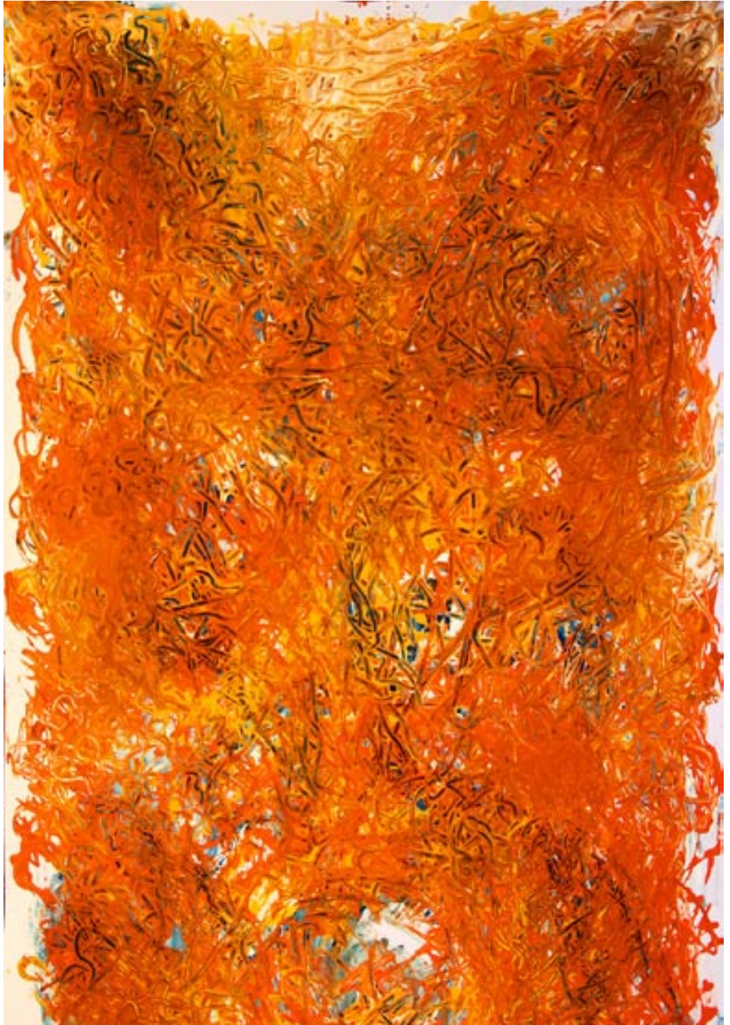
Fraktal (Wildsee) - 2010 - Acryl auf Fedrigoni Karton 70 x100 cm