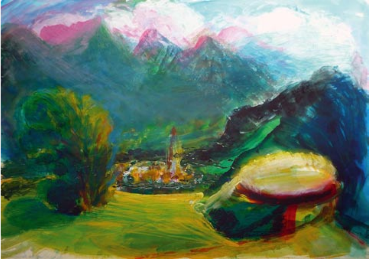
Mals - 2009 - Acryl auf Fedrigoni Karton 70 x 100 cm