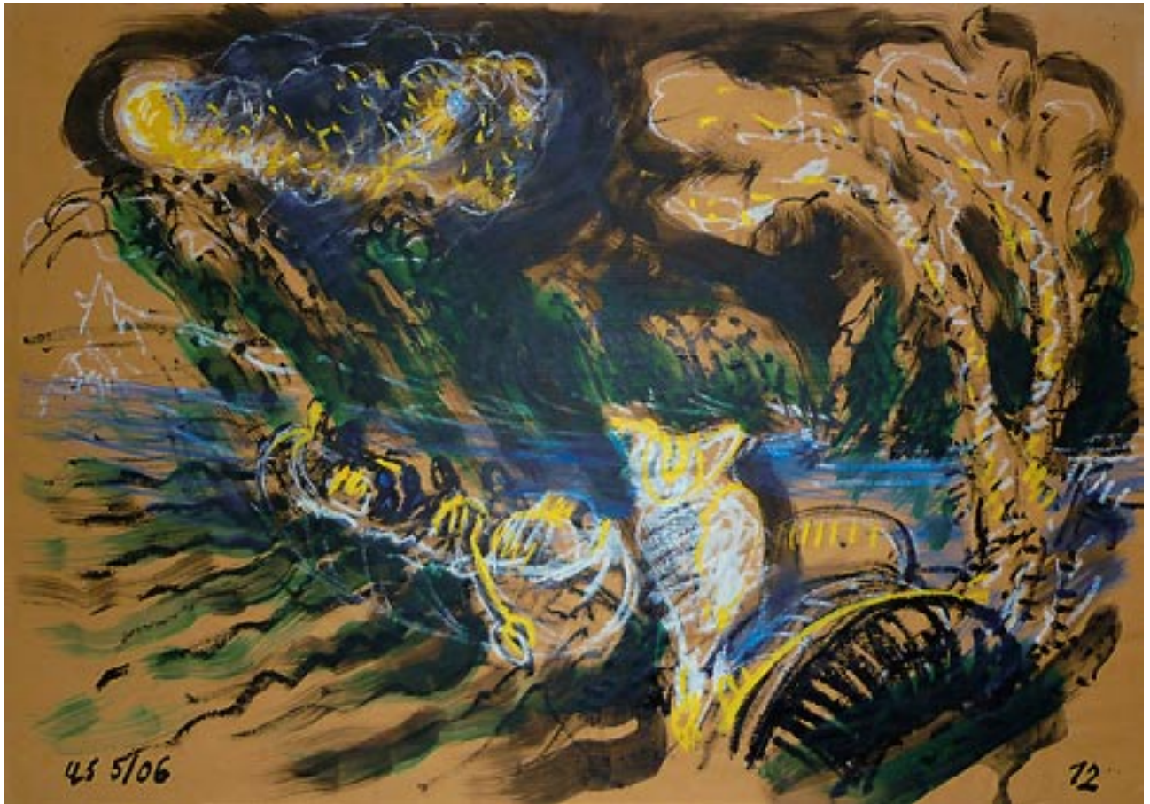
Flight / Flucht - 2006 - Acryl auf Packpapier 56 x 78 cm 37