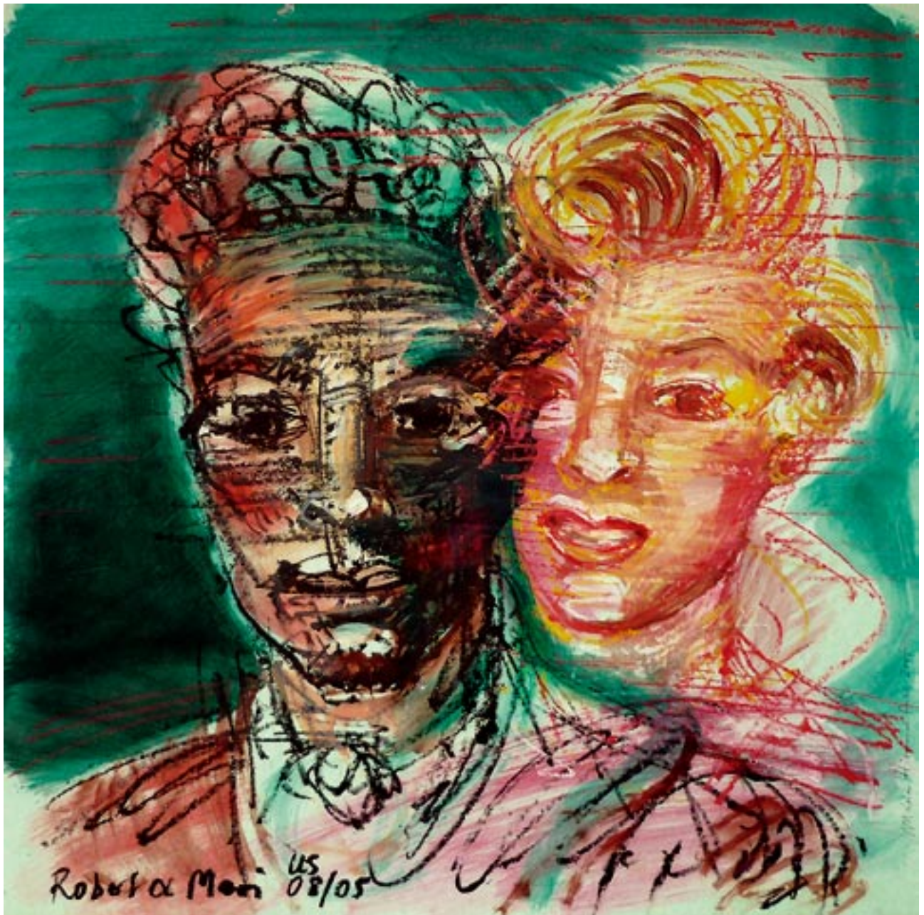
Physiker - 2005 - Kreide, Acryl auf grünem Fedrigoni Karton 78 x 56 cm