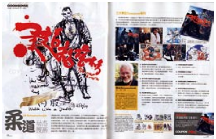
Lazarus's hit - 2000 - Kreide, Acryl auf Papier 78 x 56 cm / for Johnny To film „Throw down“