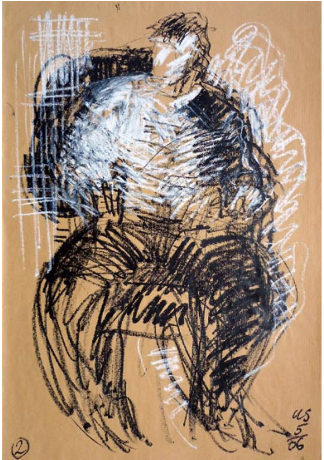
Drawing in darkness / zeichnen im Dunklen (Dan Ennis) - 2006 - Kreide auf Packpapier 56 x 78 cm