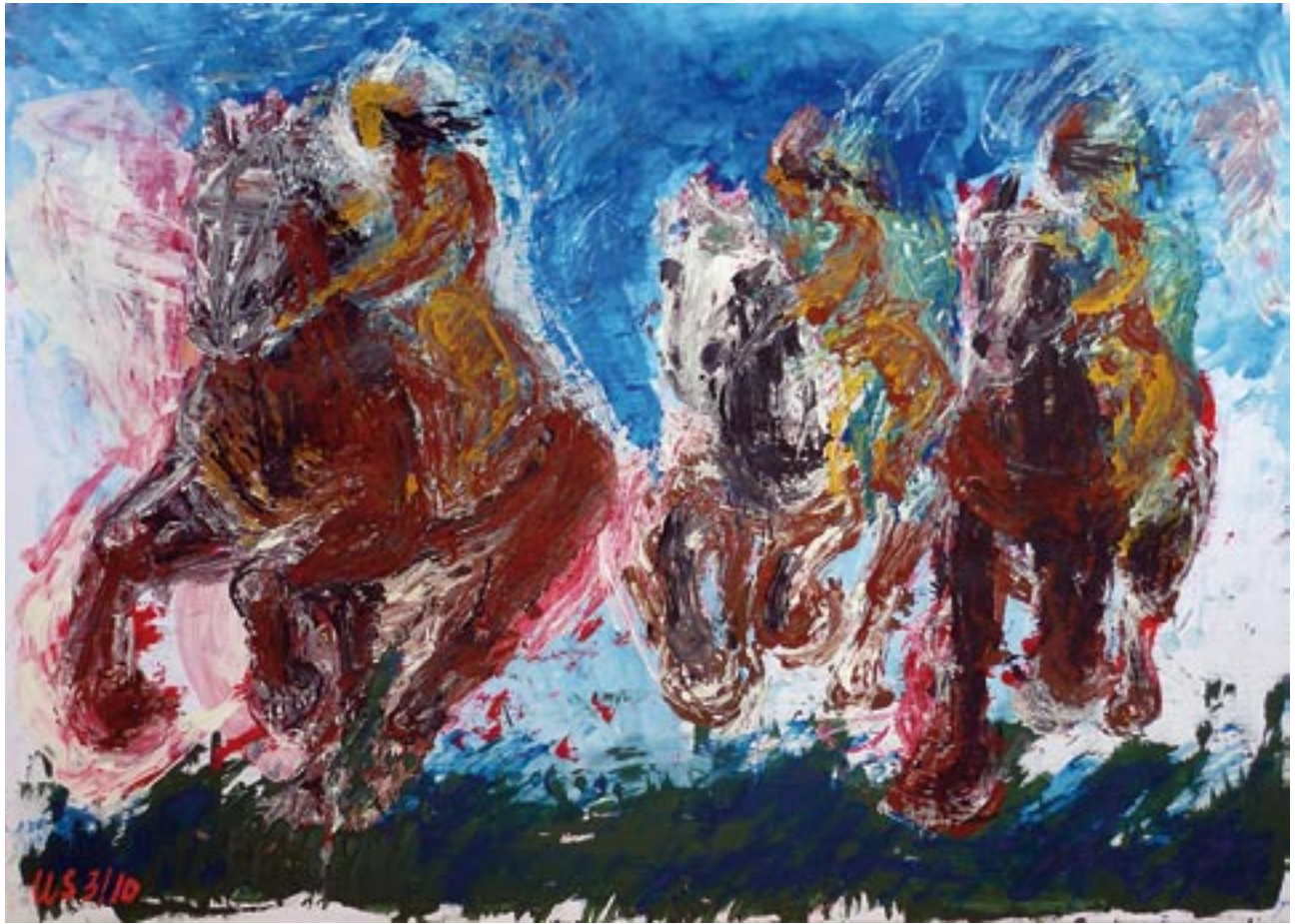
Riders / Reiter - 2007 - Acryl auf Papier 70 x100 cm