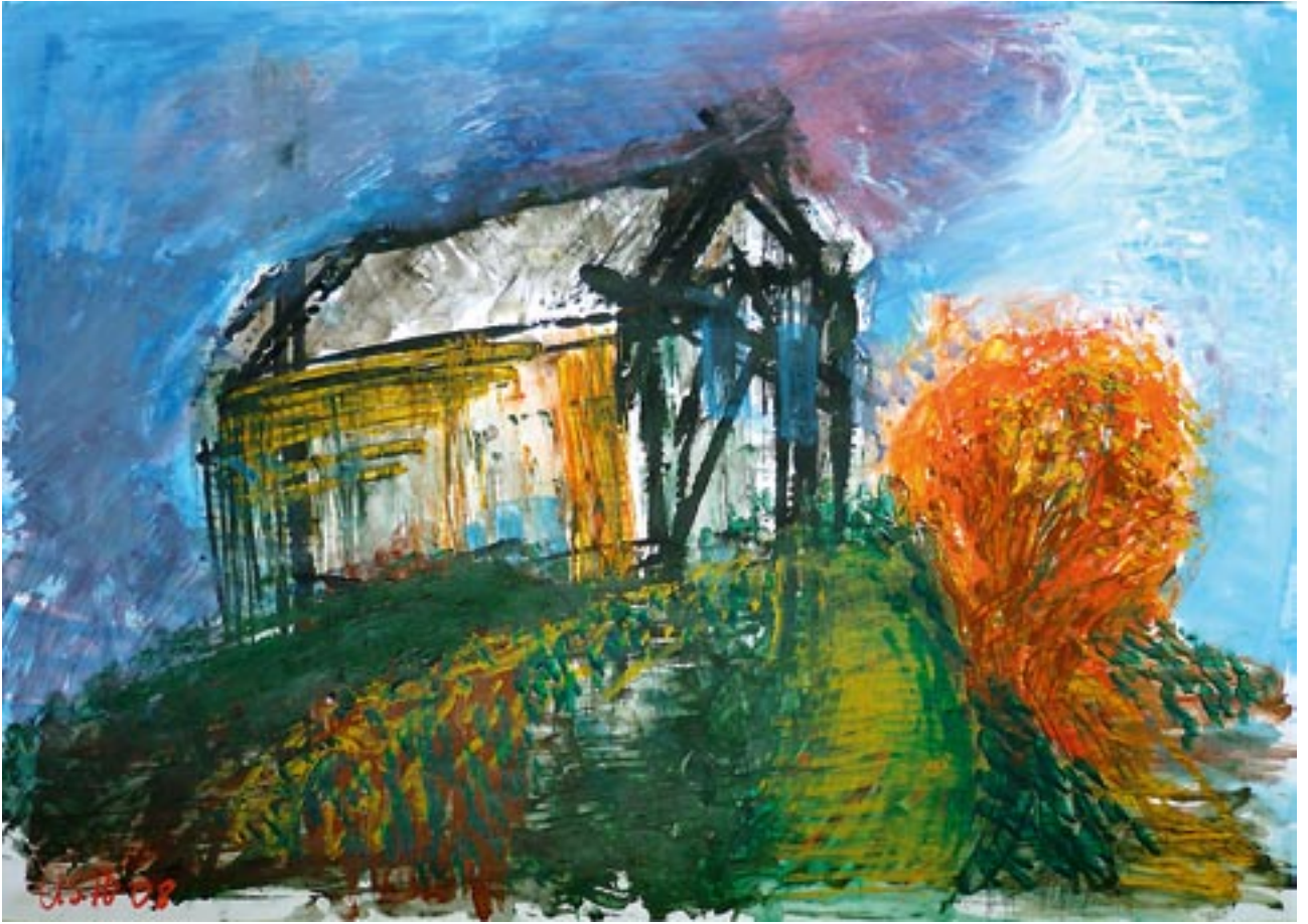
Left / verlassen - 2008 - Acryl auf Fedrigoni Karton 70 x 100 cm