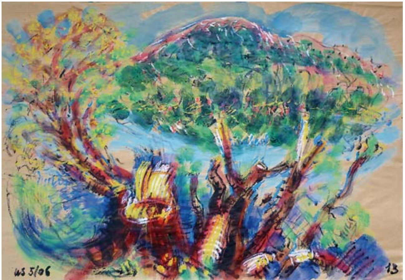
The point / der Punkt - 2006 - Acryl auf Packpapier 56 x 78 cm