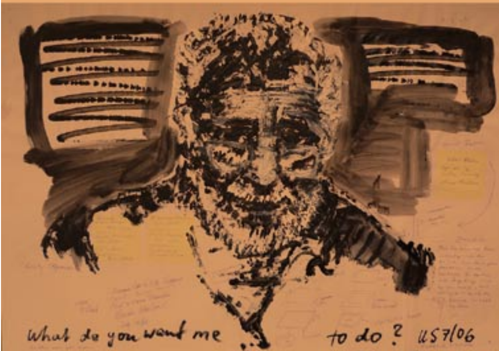
Foxy lady - 2006 - Acryl auf Papier 56 x 78 cm