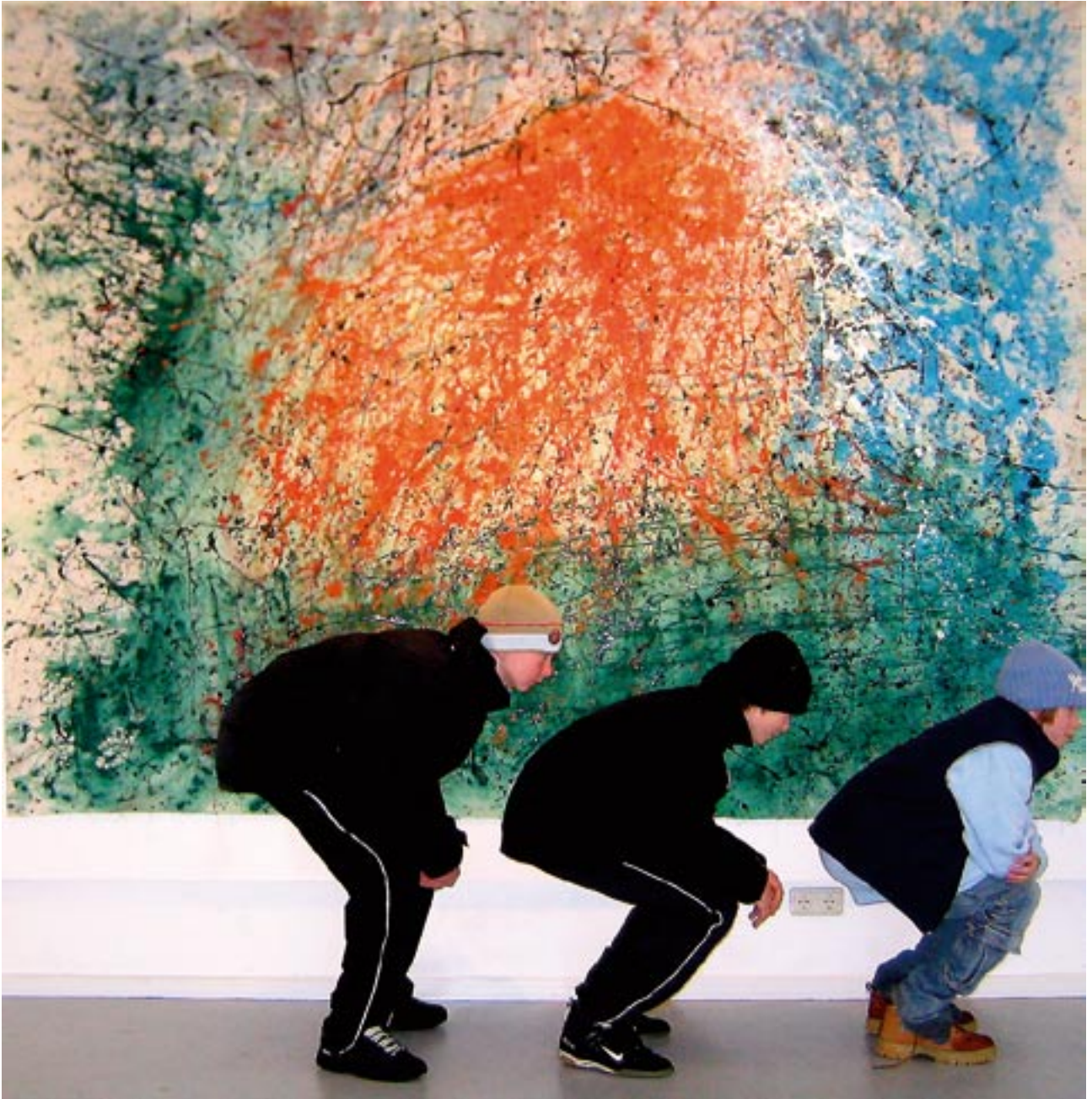
Hamburger Jungs vor Wildsee - 2004 - Acryl auf Leinwand 200 x 300 cm