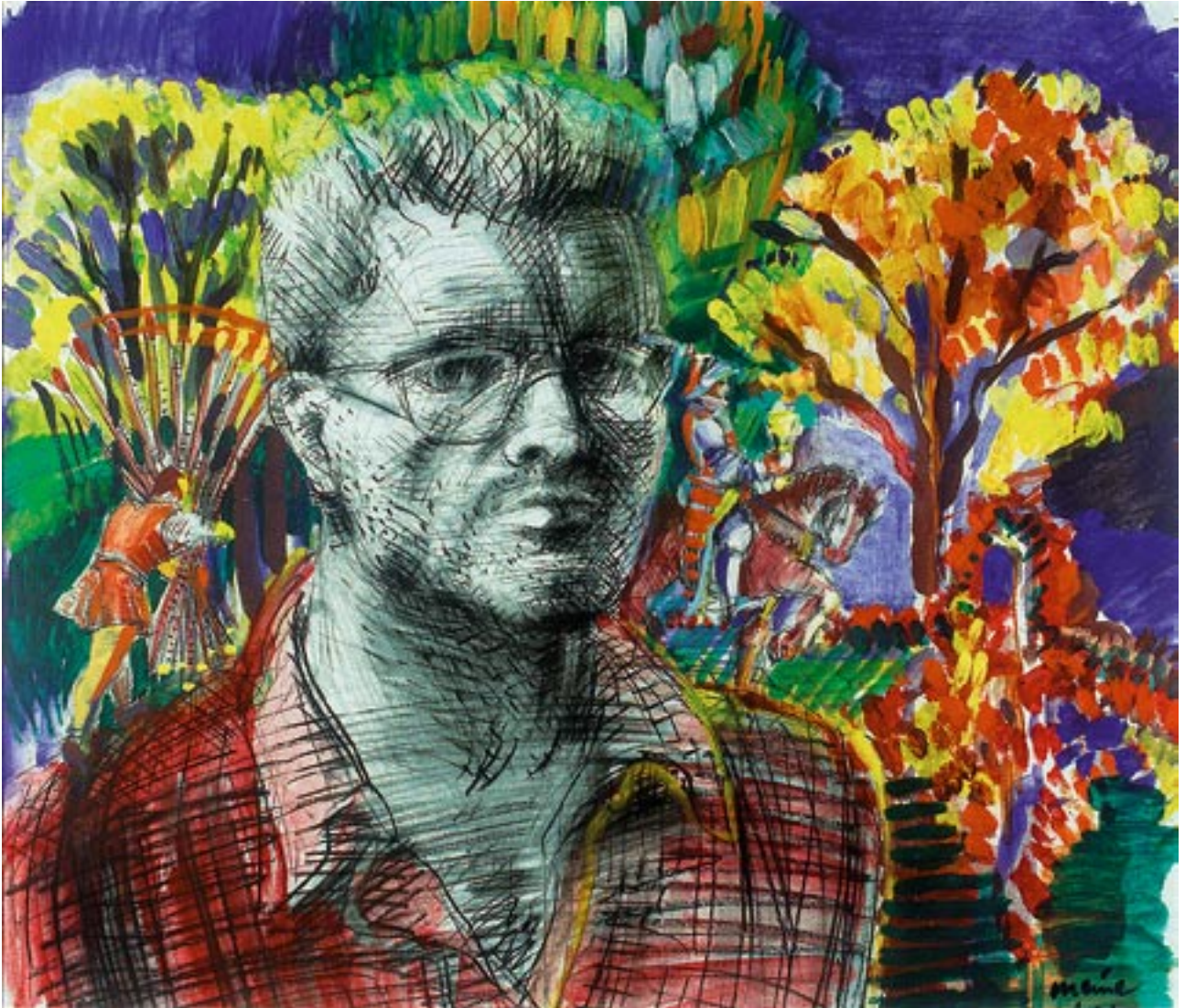
meine Welt - 1993 - Kreidezeichnung, Öl auf grünem Fedrigoni Karton 56 x 62 cm