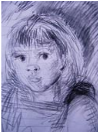
Effie's Lane / Effies Weg - 2006 - Acryl auf Papier 56 x 78 cm / Donna's kids detail / Schwestern - Kreide *)