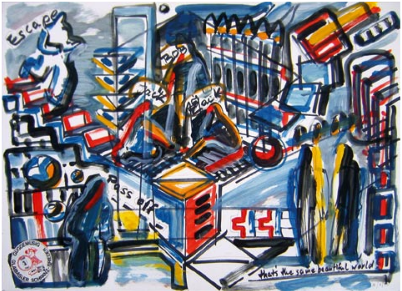
Down by law, Film - 1990 - Öl auf Karton 60 x 80 cm