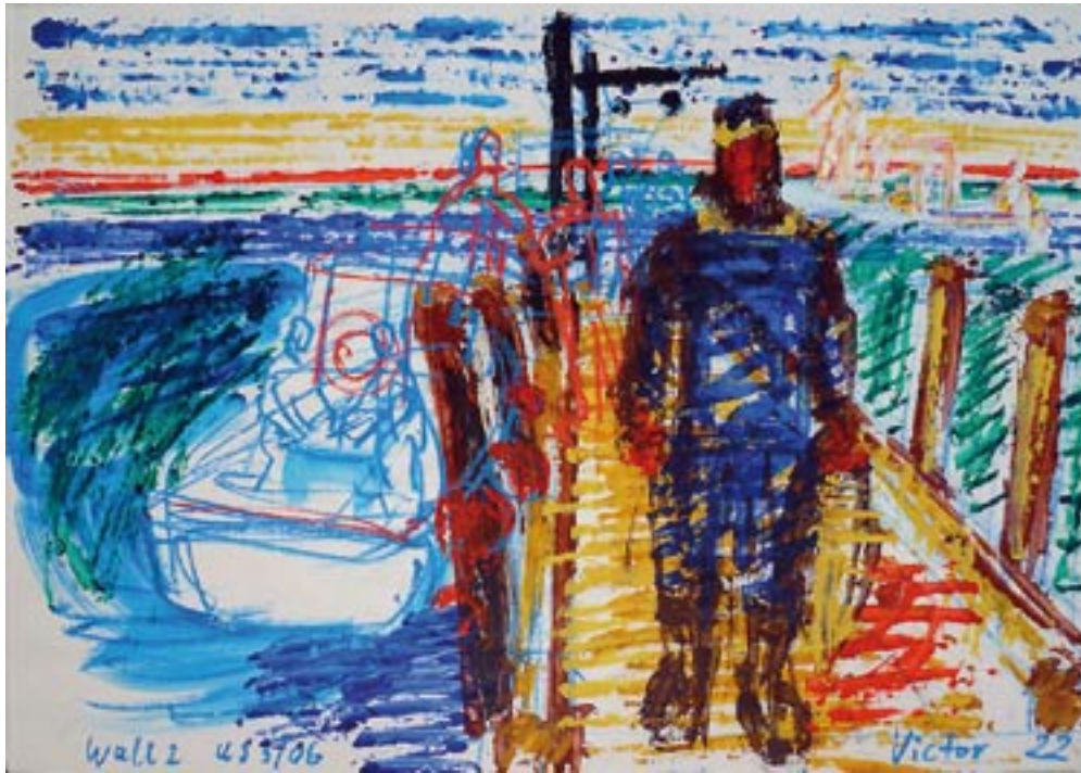
Geronimo writing (Charles Gaines) / schreiben - 2007 - Kreide, Acryl auf Fedrigoni Karton 56 x 78 cm