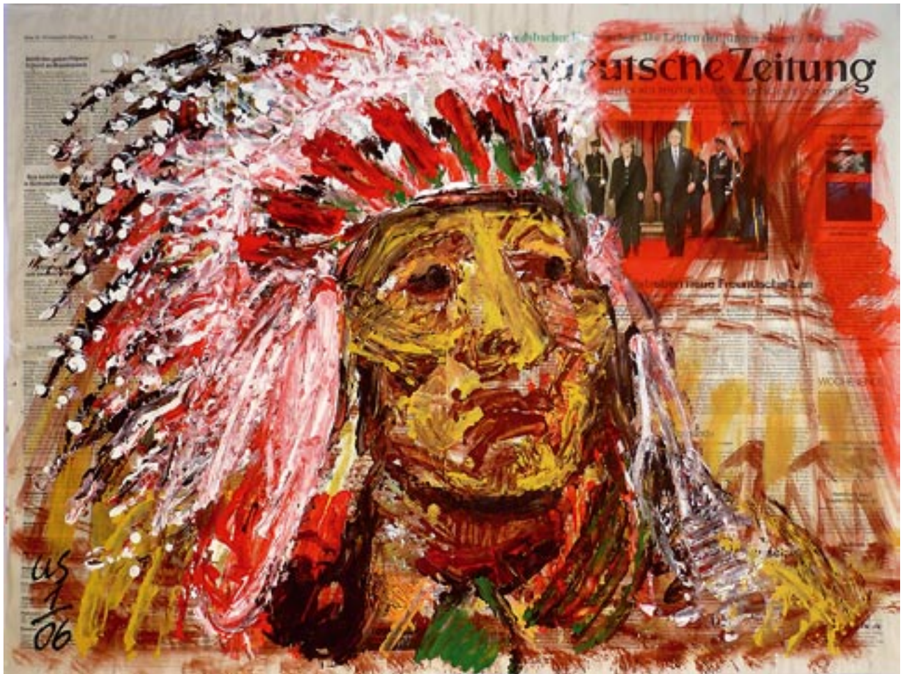
1950 - 2011 - Kreide, Acryl auf Süddeutscher Zeitung 80 x 57 cm