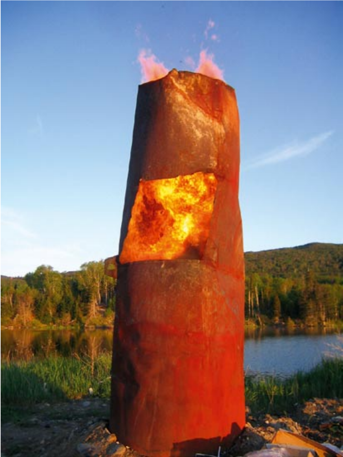
Incenerator, Little river - 2006