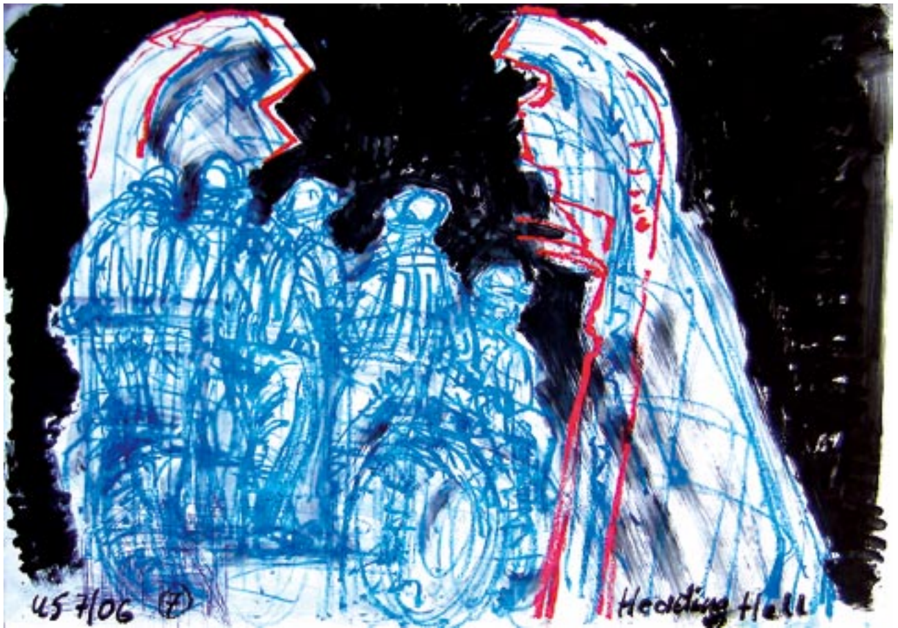
Heading hell (rescue team) / in die Hölle - 2006 - Acryl auf Papier 56 x 78 cm