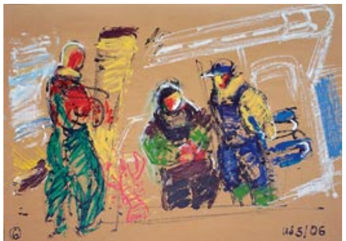
Cleaning / klar machen - 2006 - Acryl auf Packpapier 56 x 78 cm - Smoking / rauchen