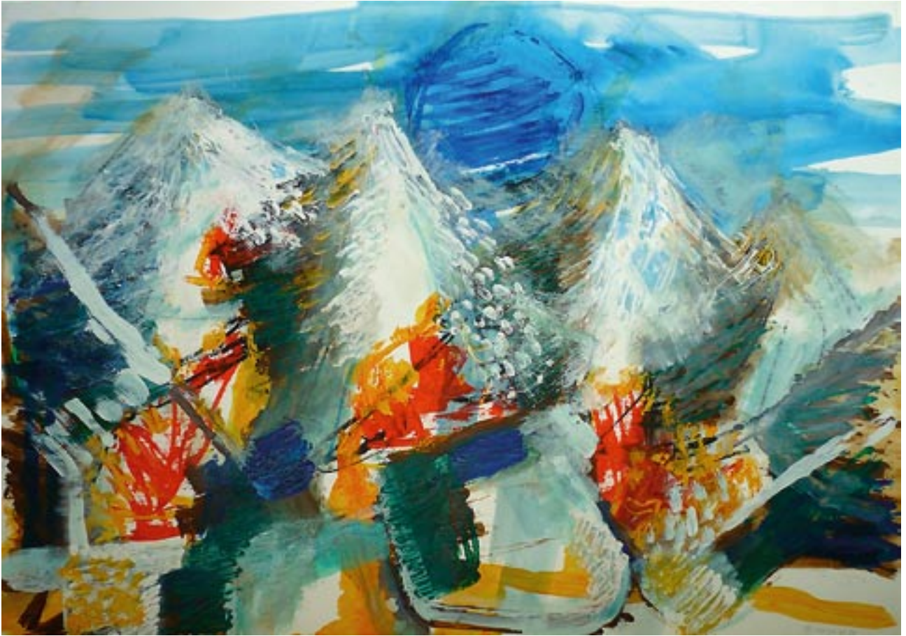
Ortlergruppe - 2009 - Acryl auf Fedrigoni Karton 70 x 100 cm