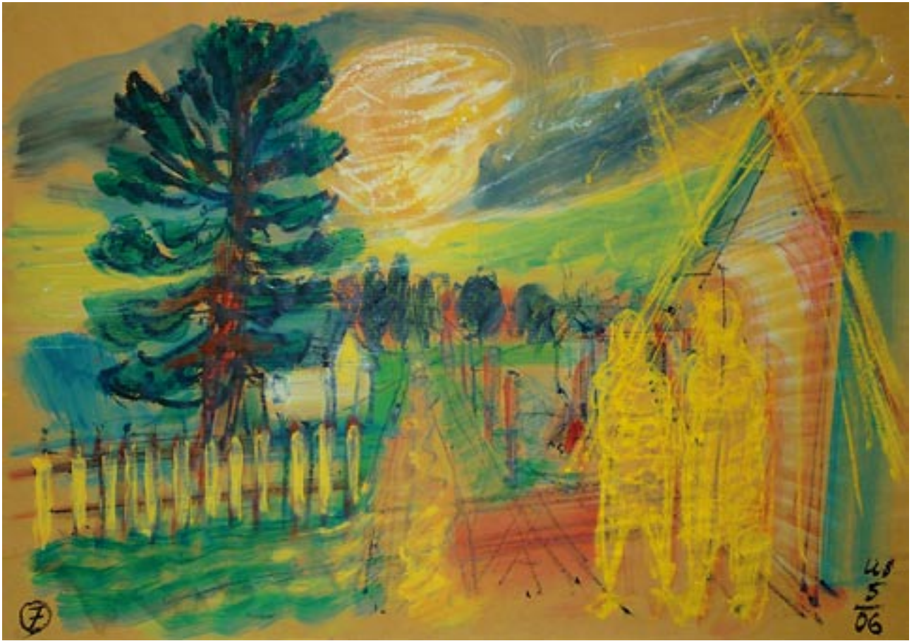
Sisters / Schwestern - 2006 - Acryl auf Packpapier 56 x 78 cm