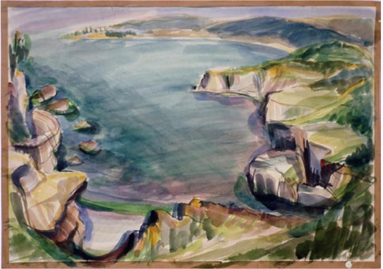
am Meer - 1986 - Aquarell 60 x 80 cm