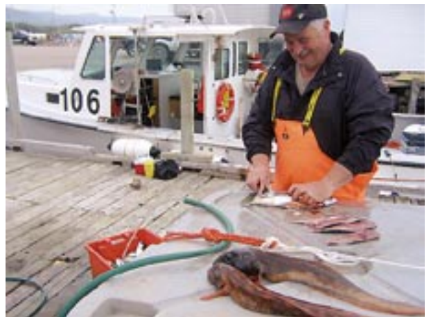
Victor: better safe than sorry / besser vorgesorgt - 2006 - Acryl 56 x 78 cm - Merral filleting fish