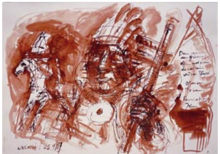
Tobique - 2006 - Acryl auf Packpapier 56 x 78 cm - White horse - Sepia Zeichnung