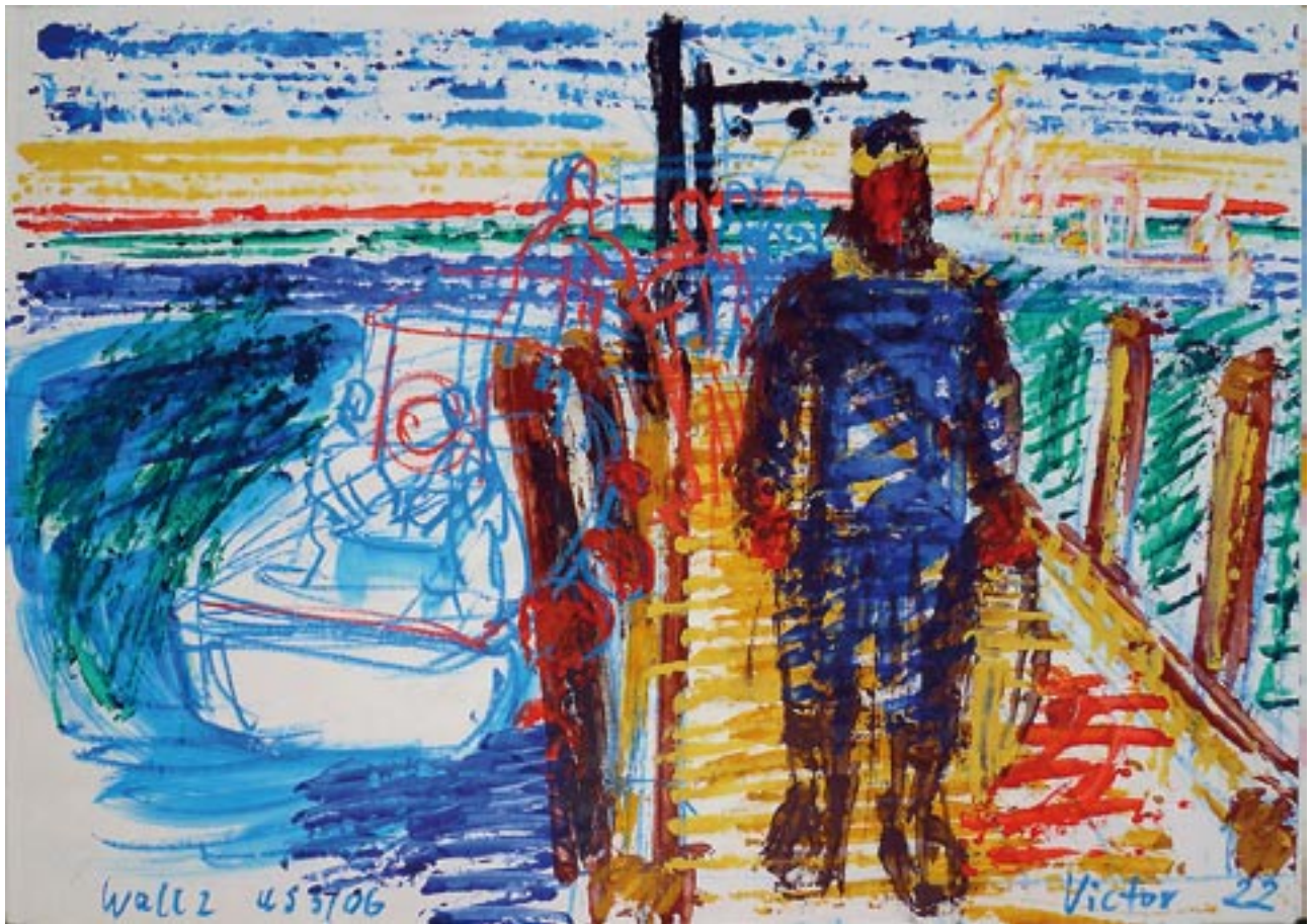
Fisher man / Fischer - 2006 - Acryl auf Papier 56 x 78 cm