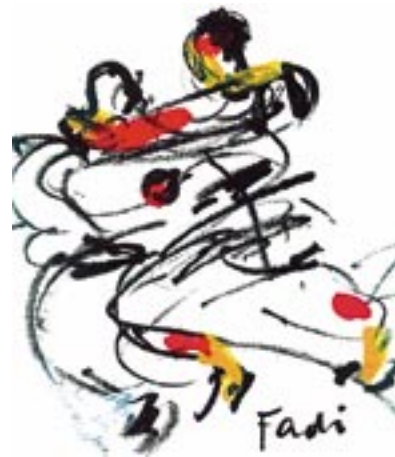
Mizuguchi: Spirit, skills and body that's Karate. If you miss one of this three there is no Karate. / Karate ist Geist, Erfahrung und Körper. Wenn eins fehlt, dann ist es kein Karate. - Kreide, Acryl 78 x 56 cm