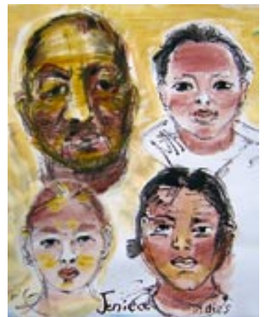
Eskasoni kids - 2007 - Acryl auf Papier 56 x 78 cm