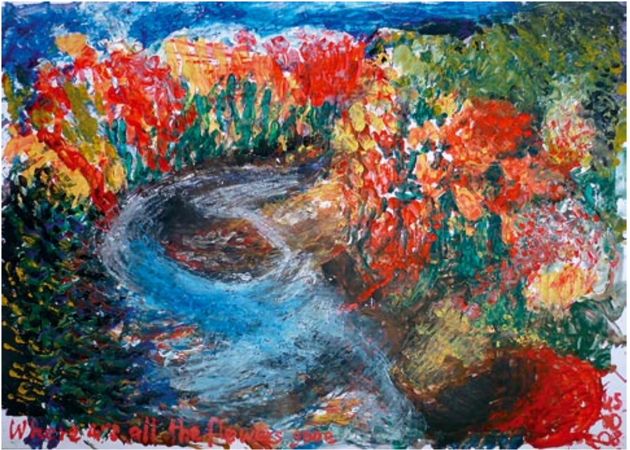
Indian brook / Indianerfluss - 2008 - Acryl auf Fedrigoni Karton 70 x 100 cm