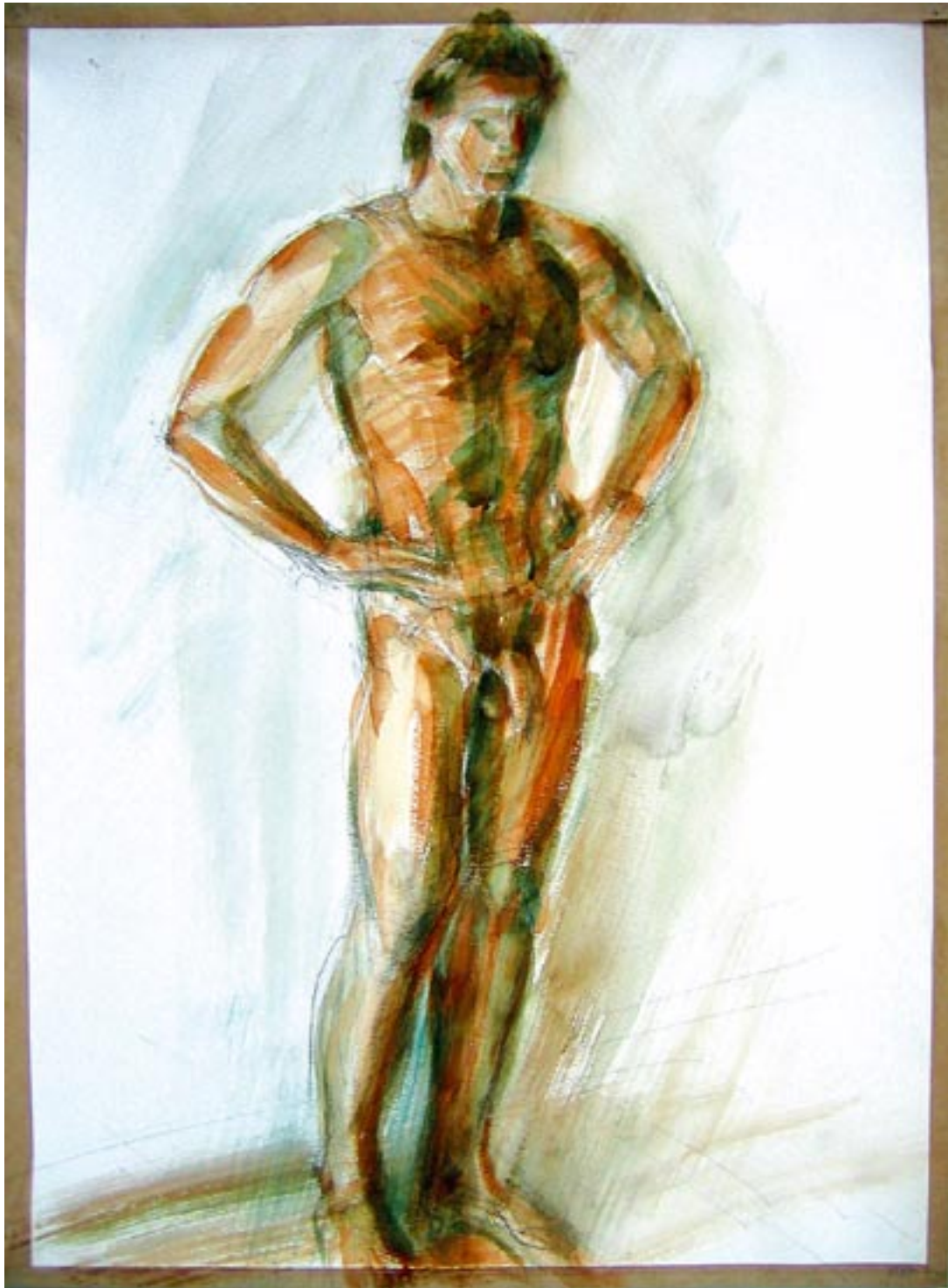
Stehender Akt - 1988 - Aquarell 36 x 48 cm