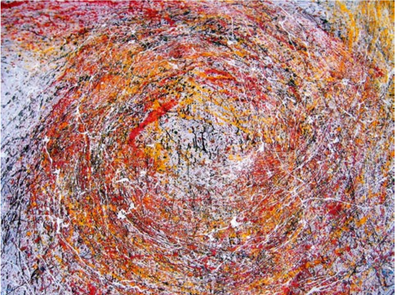
Fusion - 2004 - Acryl auf Leinwand 200 x 300 cm