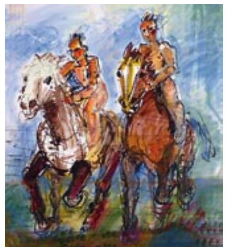
Berlin 1989 - Öl auf Karton 60 x 80 cm *) - Mohawk