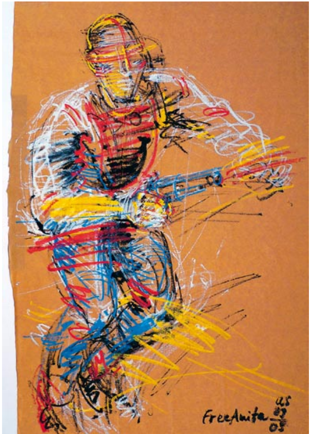
2005 - Acryl auf Packpapier 56 x 78 cm