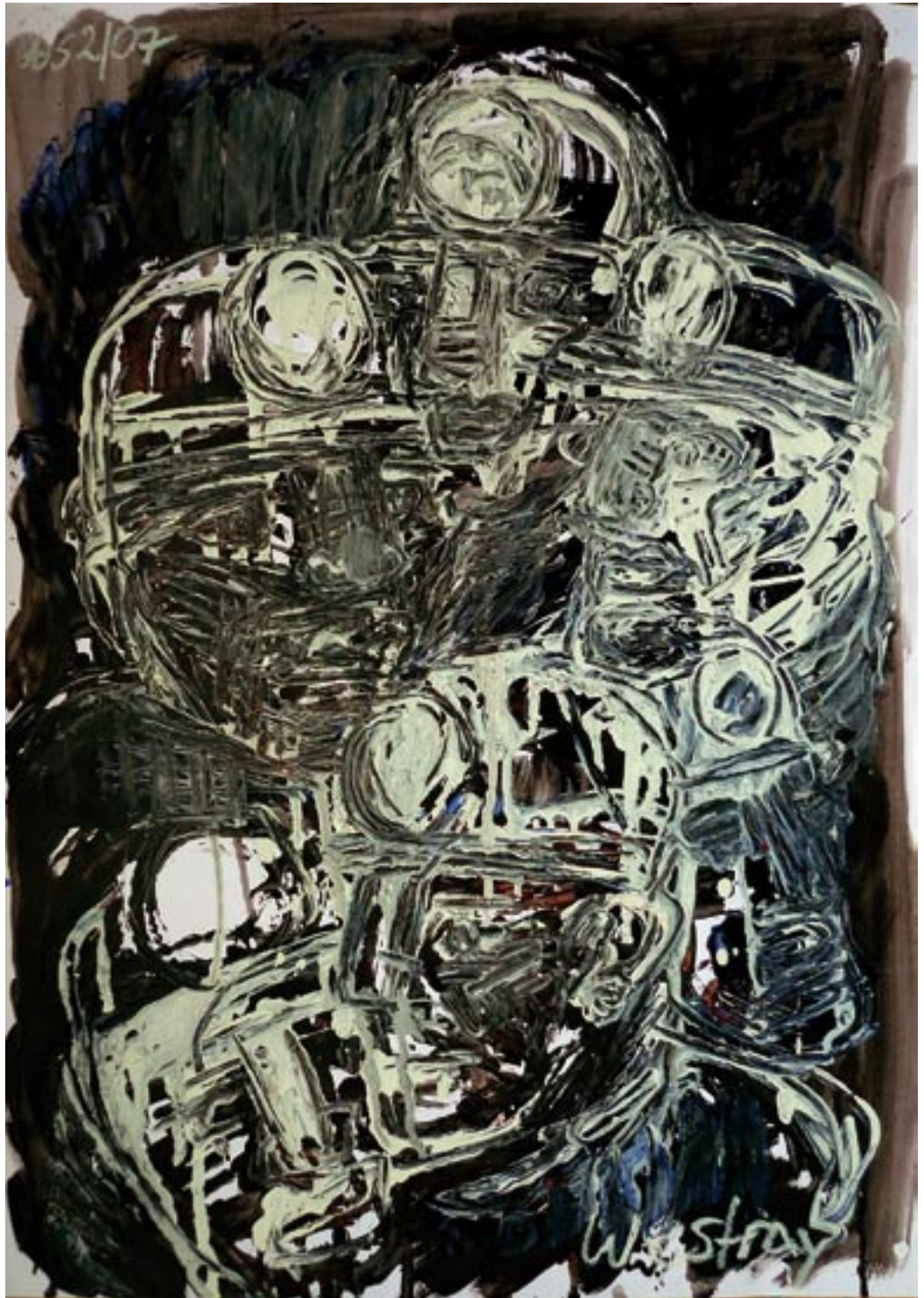
Westray - 2007 - Acryl auf Fedrigoni Karton 56 x 78 cm