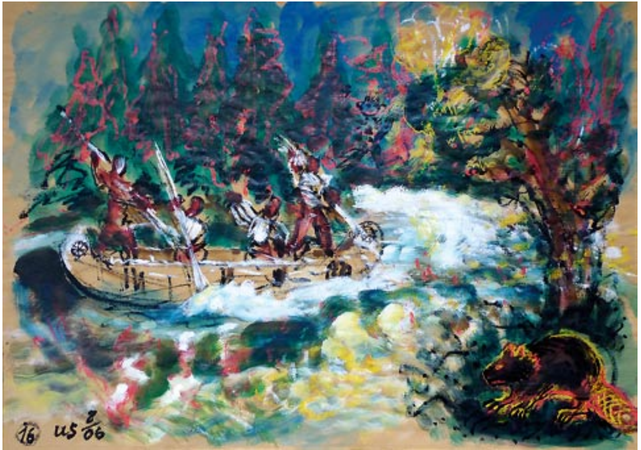
Canoe ride / Kanu Fahrt - 2006 - Acryl auf Packpapier 56 x 78 cm