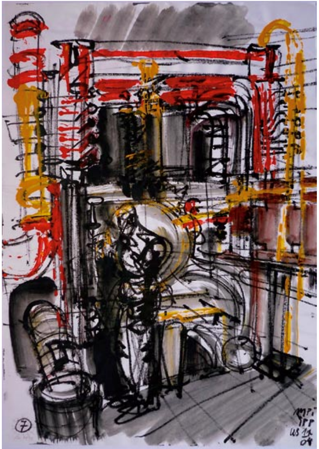
Experiment - 2004 - Kreide, Acryl auf Papier 78 x 56 cm