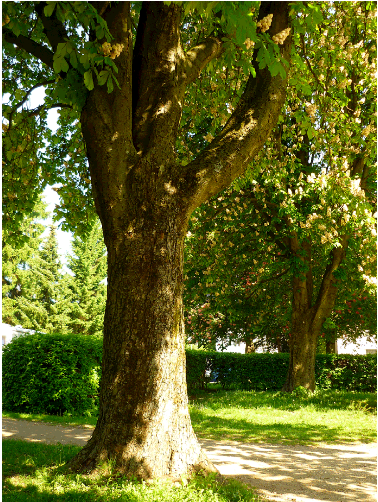
90 Kastanien im Eichendorffplatz, München Mai 2012; stark, gross, weg. Foto: U. Schaarschmidt - Gebt den grossen Bäumen ihre Würde zurück.